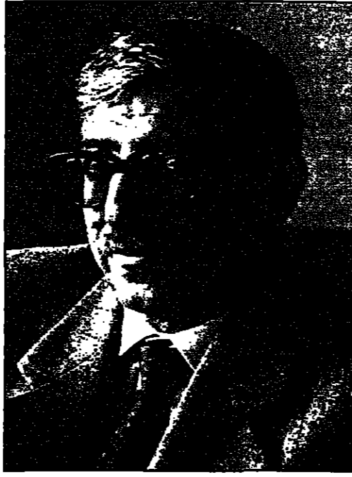
عبد العزيز المقالح